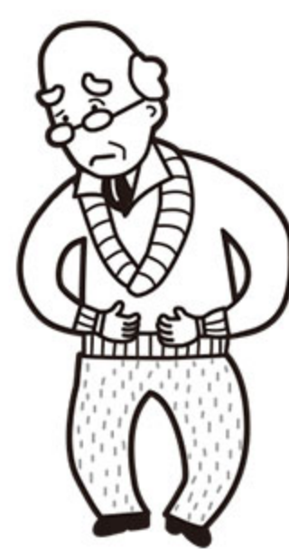
腸の老化からくる便秘・ 軟便が気になる方